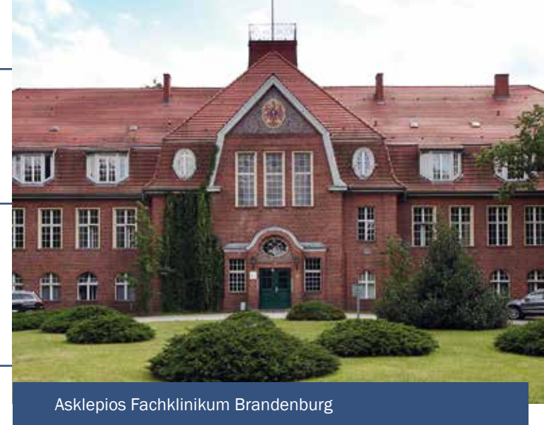
Asklepios Fachklinikum Brandenburg

Klinik für Psychiatrie, Psychosomatik und Psychotherapie